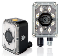
Vision processors & smart cameras