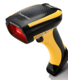
Hand held scanners