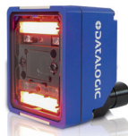
Stationary industrial scanners