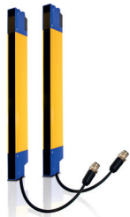
Safety light curtains