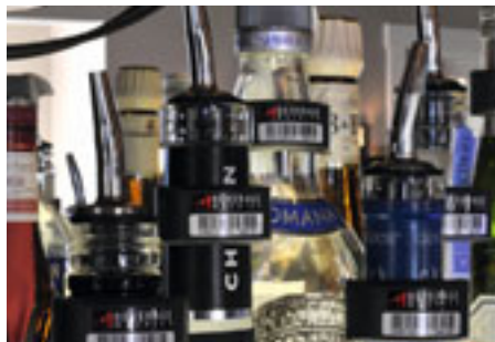
RFID und Sensoren in der Hotelbar (Identec Solutions)

In dem Sonderbereich AutoID/RFID Solutions Park auf der CeBIT (1. – 5. März in Hannover) wurden wieder innovative AutoID-Anwendungsszenarien – „Leuchttürme“ – gezeigt. Das Innovative Retail Laboratory (IRL: www.innovative-retail.de ), das das Deutsche Forschungszentrum für Künstliche Intelligenz (DFKI) in Kooperation mit der Globus SB-Warenhaus Holding betreibt, zeigte, wie es mit RFID im Supermarkt weiter geht. Das Forschungsprojekt RAN (RFID-based Automotive Network: www.auran.de ), geleitet von Daimler und gefördert vom Bundesministerium für Wirtschaft und Technologie, demonstrierte Effizienzfortschritte in der Lieferkette. In einer „Hyatt-Hotelbar“ ließen sich die Besucher zeigen, wie der Getränkervorrat mit Hilfe von RFID und Sensoren bewirtschaftet wird. Mitten im Sonderbereich zeigten sich der AIM-Gemeinschaftsstand und das AutoID-Forum mit über 40 Expertenvorträgen. Das übereinstimmende Fazit der Aus-