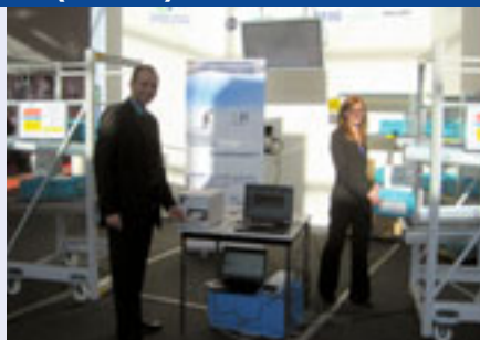
Pull-Prozess im T&T

Weiteres Highlight im T&T ist die Demonstration der Fraunhofer-Gruppe für Intelligente Objekte (ZIO) zur Ladungsüberwachung mittels drahtloser Sensorknoten. Damit entstehen sogenannte „intelligente Objekte“. Am Beispiel eines Flugzeug-Höhenmessers werden die neuen luftfahrttauglichen RFID Tags für Metalloberflächen