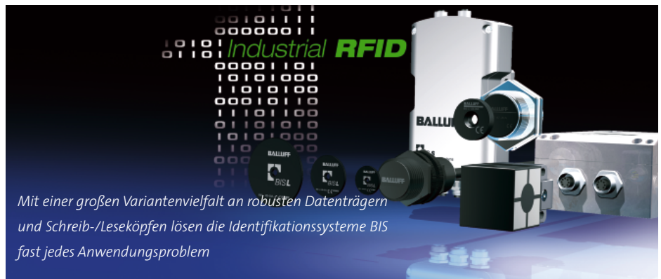
Mit einer großen Variantenvielfalt an robusten Datenträgern und Schreib-/Leseköpfen lösen die Identifikationssysteme BIS fast jedes Anwendungsproblem

Je nach Ausführung und Frequenz ermöglichen die Balluff Identifikations-Systeme