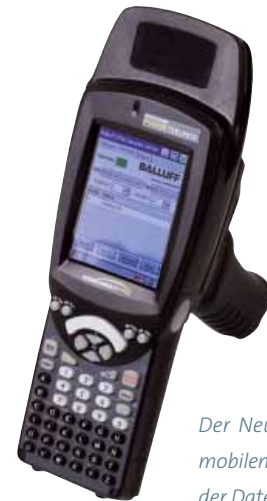
Der Neue BIS-Handheld zum mobilen Lesen und Beschreiben der Datenträger

Alle Balluff Identifikationssysteme sind leicht in Neuinvestitionen sowie auch in vorhandene Anlagen zu integrieren und amortisieren sich erfahrungsgemäß bereits innerhalb von ein bis zwei Jahren. Mit Ethernet TCP/IP und den Echtzeitvarianten EtherNet/IP und PROFINET sind Balluff Identifikations-Systeme BIS C/L/M und S kompatibel zu den gängigen Netzwerktechniken, die zurzeit hauptsächlich von den großen Automobilisten favorisiert werden. Verfügbar sind natürlich auch erste IO-Link-fähige Lesegeräte.