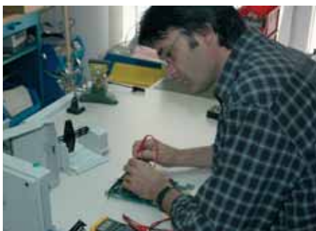
Kundenservice-Center, das mit allen nötigen Produkten und Ersatzteilen ausgestattet ist.

COSYS' Komplettlösungen finden Anwendung in den Bereichen Handel, Logistik, Produktion, bei Außendienst-anwendungen sowie in der Verwaltung und im Bereich des Gesundheitswesens. Dabei werden bundesweit Unternehmen jeder Größenordnung kompetent betreut. Das Spektrum der Kunden reicht dabei von großen Automobilherstellern über Handelsunternehmen der verschiedensten Größenordnungen, Behörden, Krankenhäuser und Dienstleister bis hin zu Messgesellschaften.