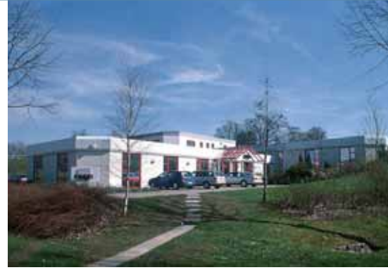
Firmensitz der COSYS Ident GmbH in Holle OT Grasdorf